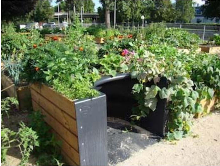
Der Garten von Delphine