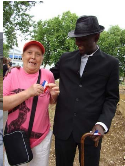
Die Freude der neuen Gärtner

Weniger als zwei Monate später (11. August)