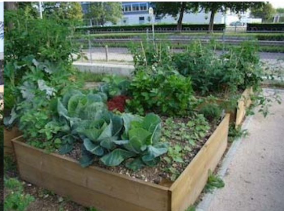
Das Gemüse sieht prächtig aus