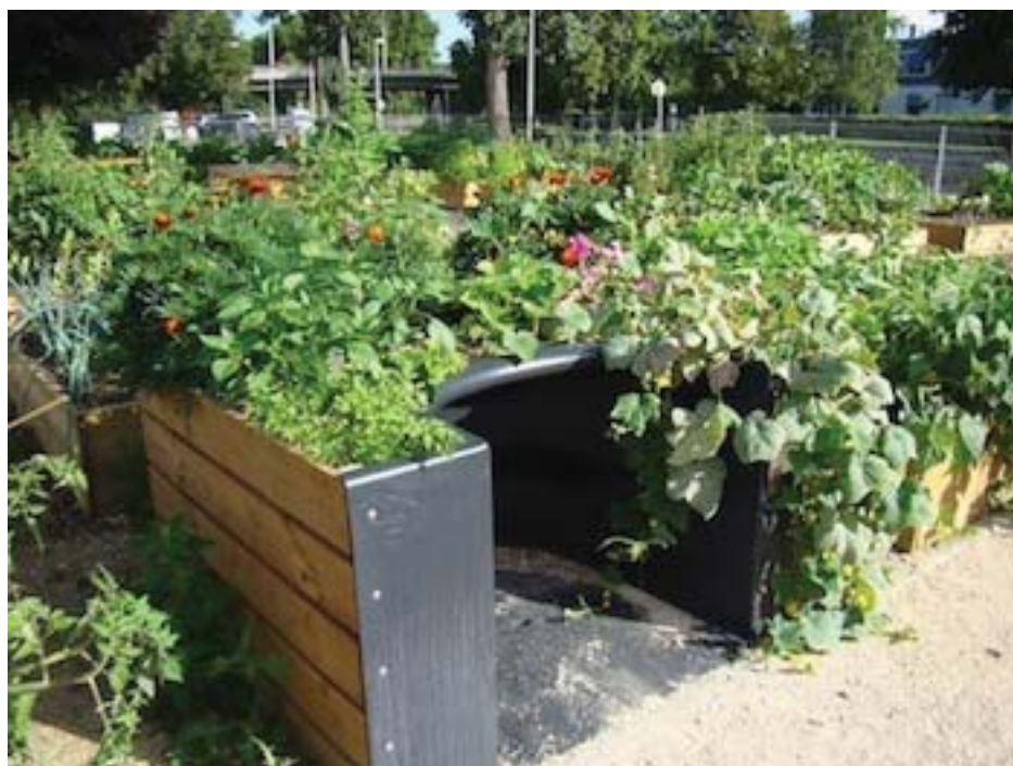
Le jardin de Delphine