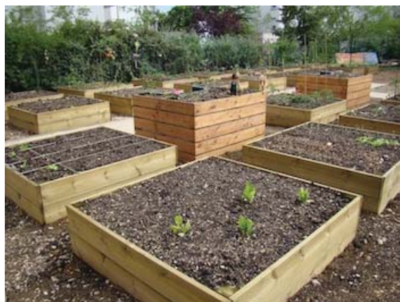
Les bacs de culture