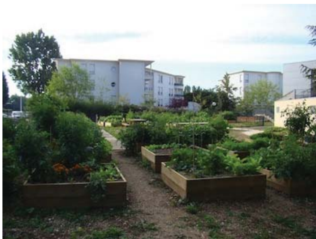
Vue depuis l'entrée du site