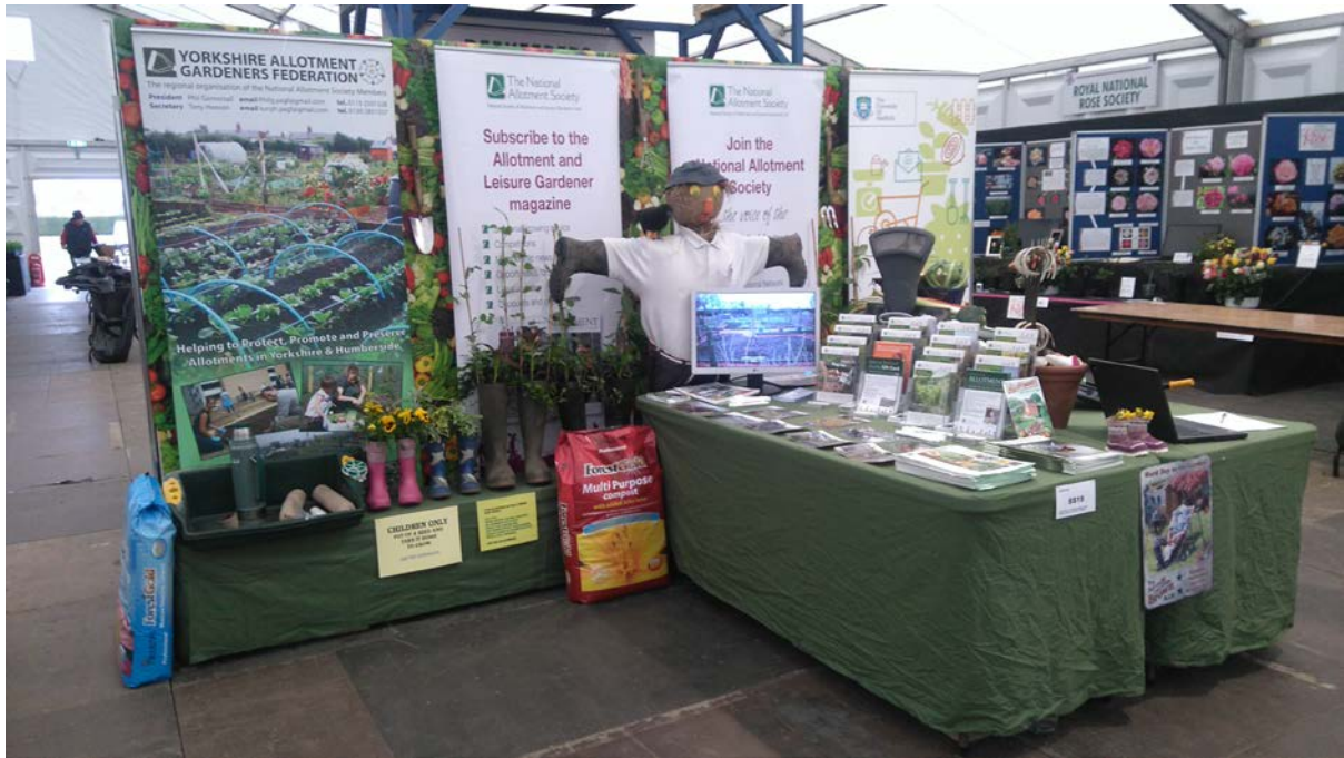
Le stand d'exposition