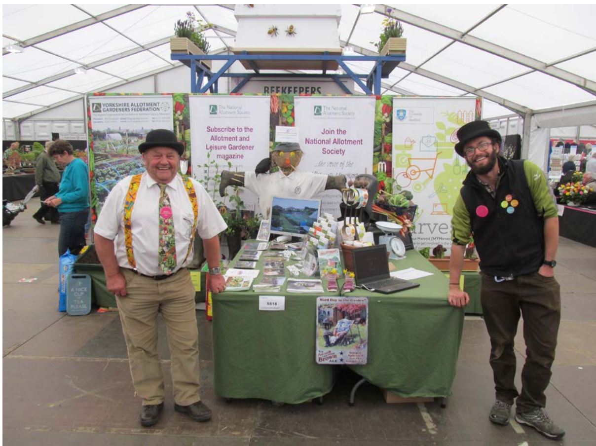
Roscoe et moi